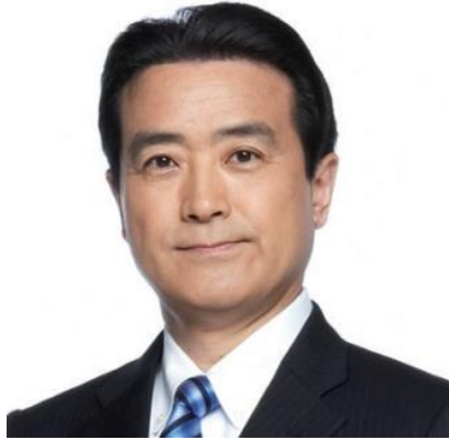
民進党代表代行 衆議院議員 江田憲司