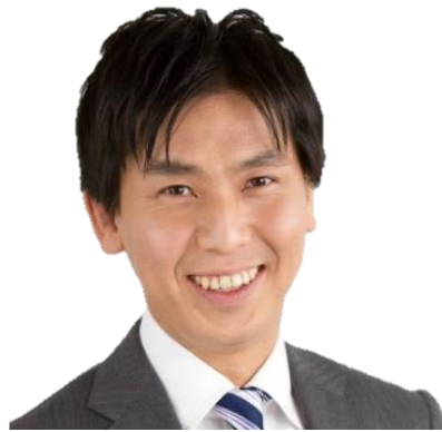
前 横浜市議員 緑区選出/3期